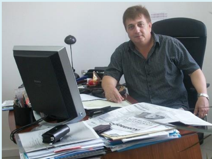
ФЕДОРЕНКО НИКОЛАЙ Режиссер-постановщик, продюсер